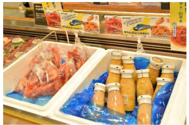
写真は前回実施時の写真です。